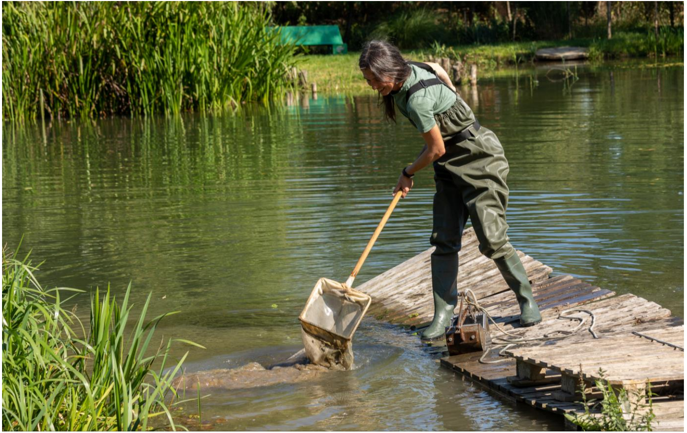
Figura 5 Prelevarea probelor de nevertebrate acvatice cu fileul limnologic