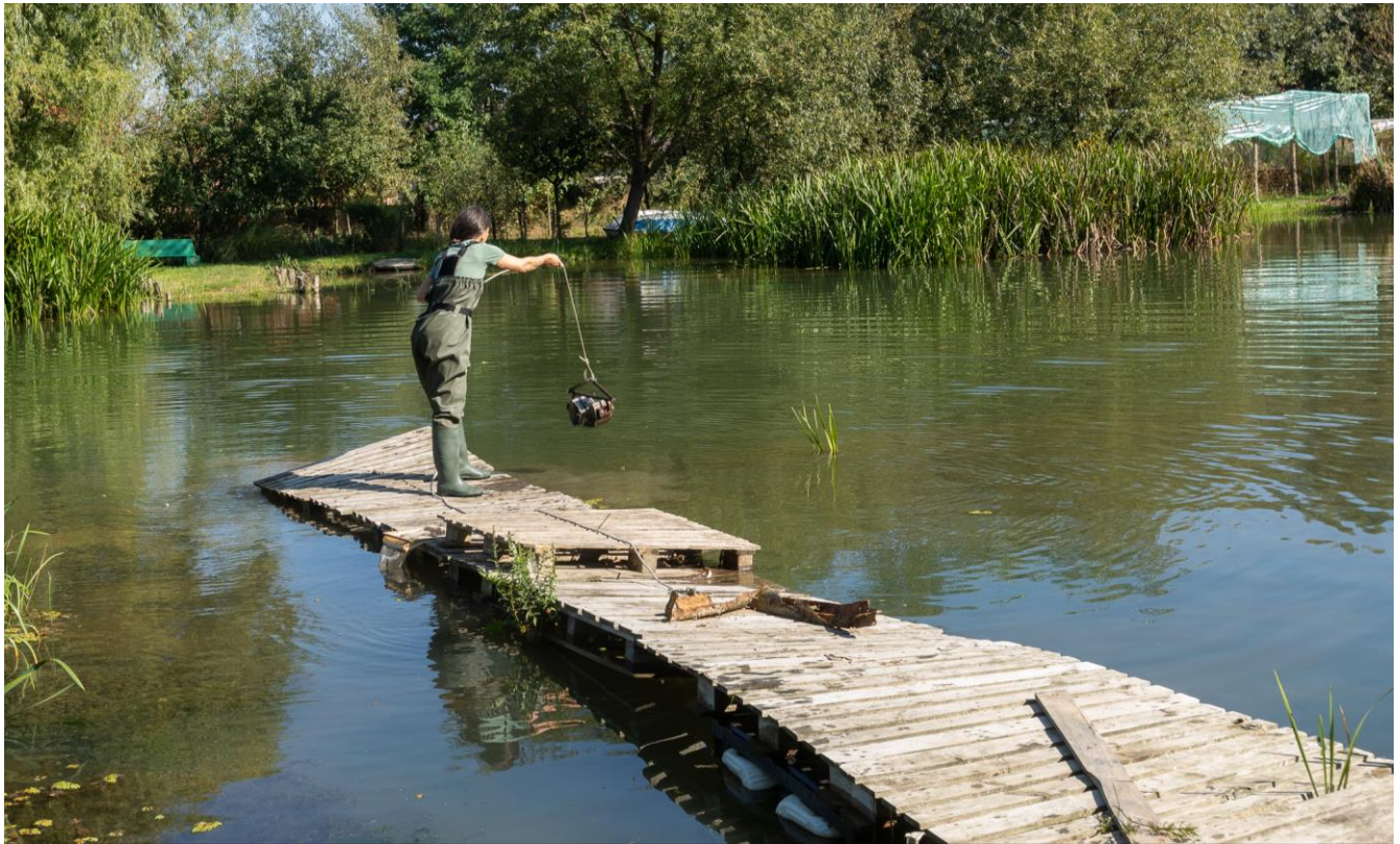
Figura 6 Prelevarea probelor de nevertebrate acvatice cu draga Ponar