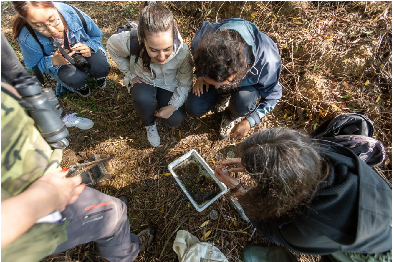
Figura 8 Sortarea nevertebratelor acvatice pe teren