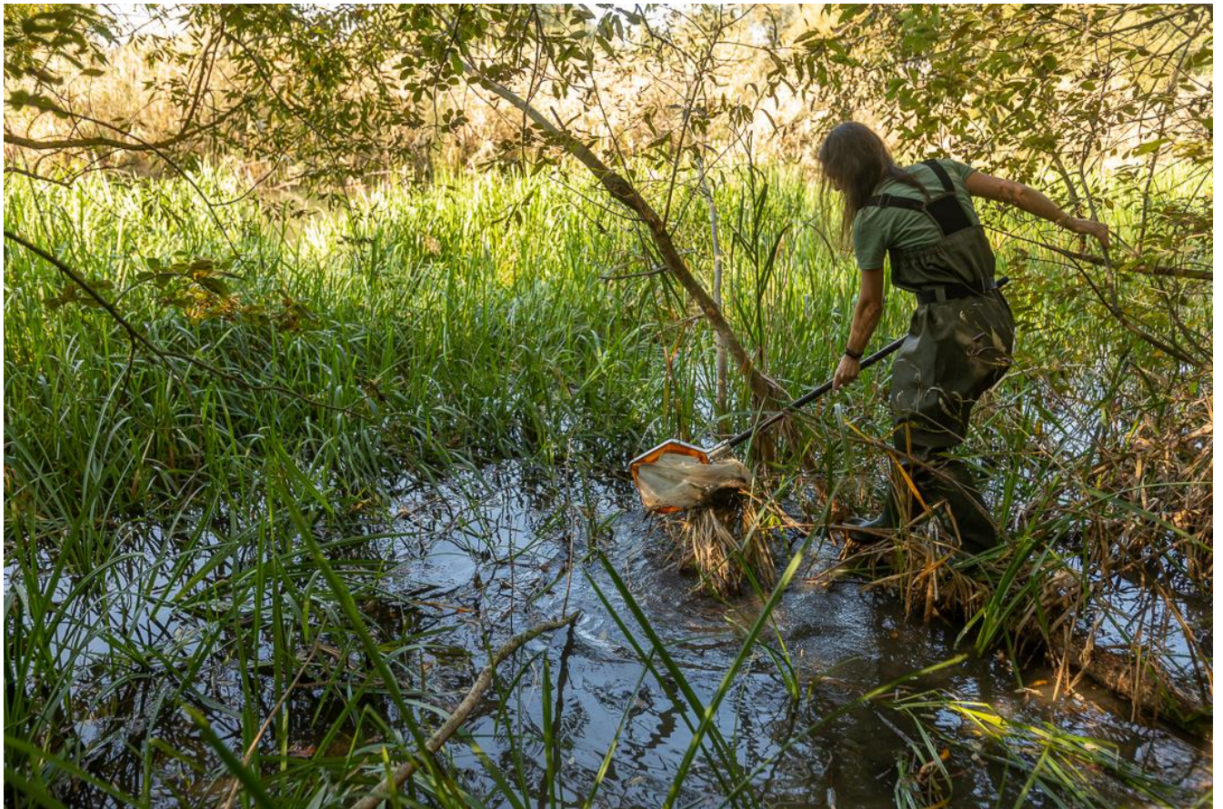
Figura 3 Stația de prelevare Bega 2