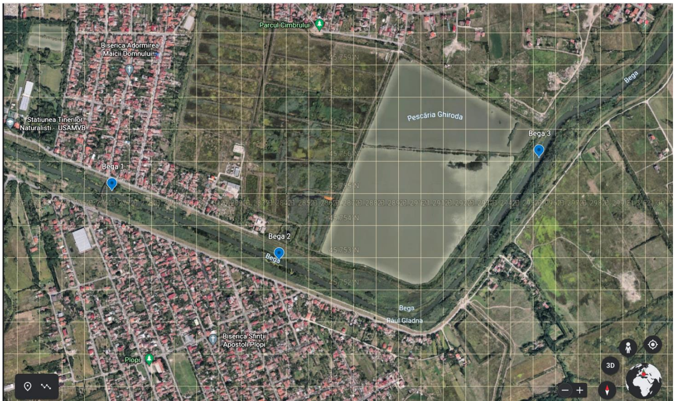
Figura 1 Localizarea punctelor de prelevare a probelor de nevertebrate acvatice pe râul Bega

Probele de nevertebrate acvatice au fost prelevate în data de 2 octombrie 2021, din 3 puncte, marcate pe harta (fig. 1) cu Bega 1 (N 45,755036/E 21,277902) (fig. 2), Bega 2 (N 45,752778/E 21,284486 (fig. 3) și Bega 3 (N 45,756079/E 21,296307) (fig. 4). La toate cele 3 puncte de prelevare a probelor substratul era constituit din argile fine și materie organică în diferite stadii de descompunere. Vegetația acvatică emersă și submersă a fost prezentă în toate punctele de colectare și de asemenea o vegetație ripariană foarte abundentă.