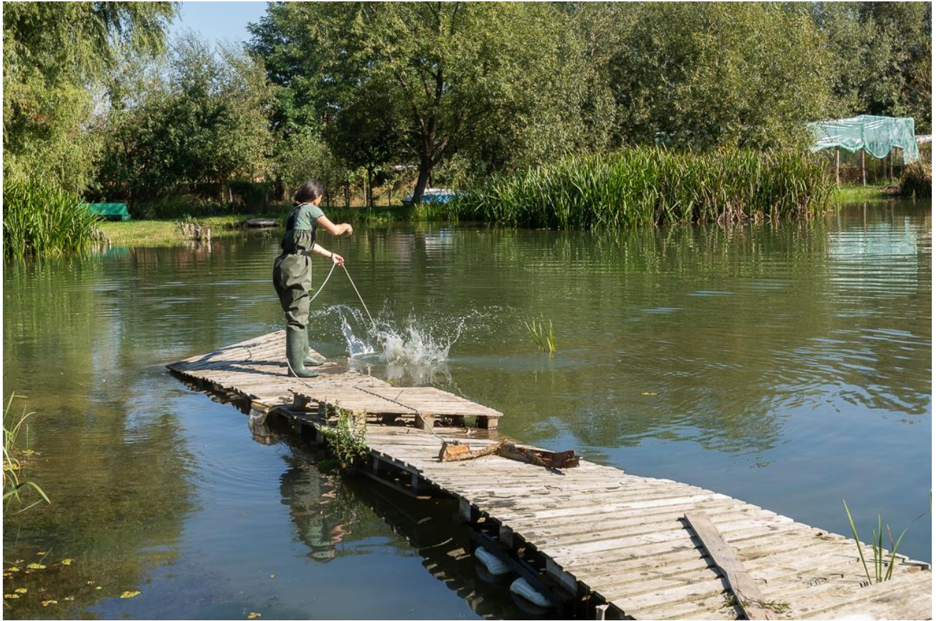
Figura 2 Stația de prelevare Bega 1