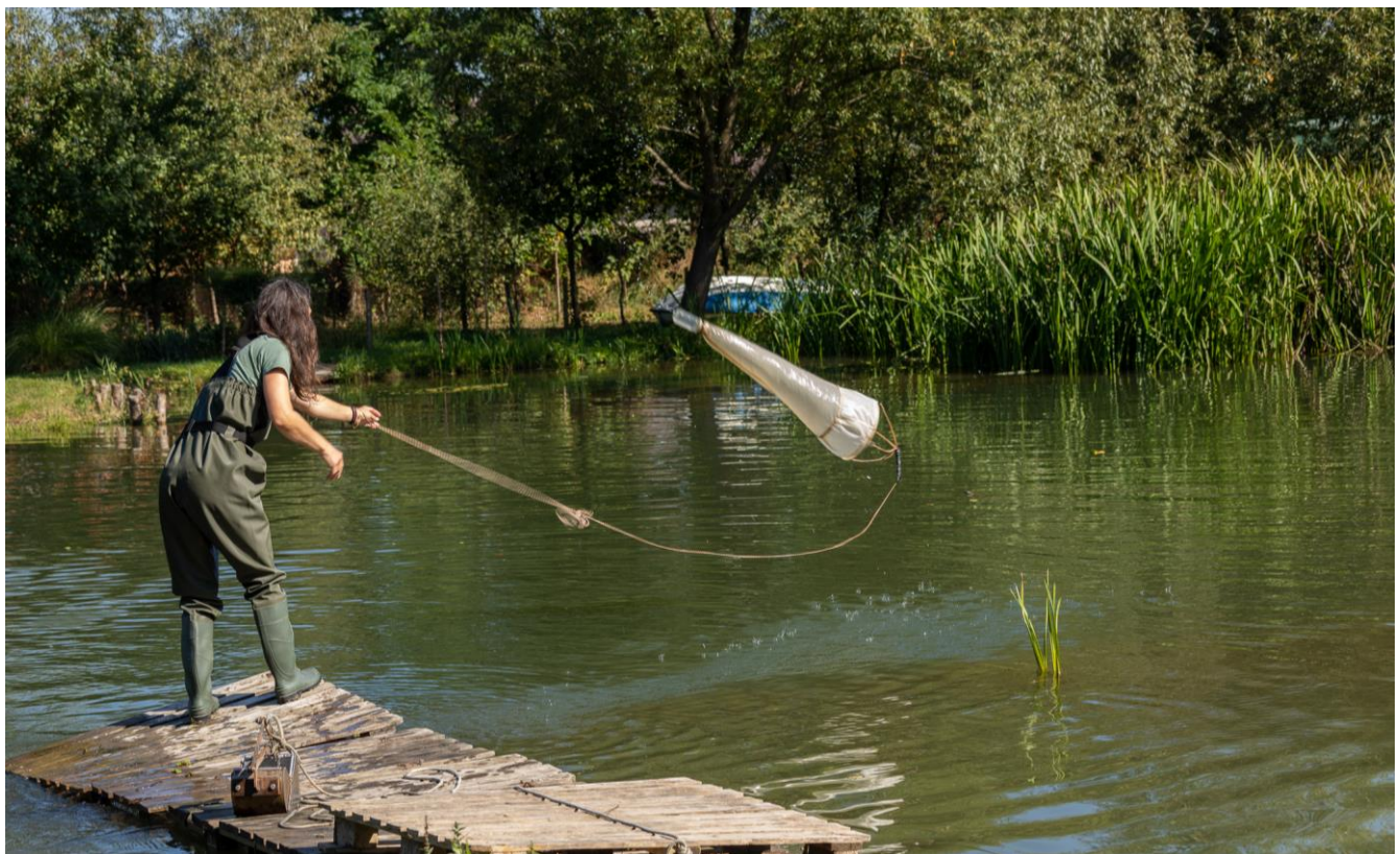
Figura 7 Prelevarea probelor de nevertebrate acvatice cu fileul zooplanctonic